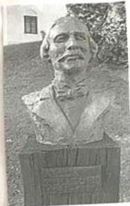
Kip Antuna Mihanovića

U dvorcu možete okusiti jedinstvena bogata jela ovog kraja, no i mnoge specijalitete.